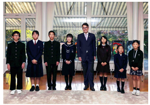
受賞者の皆さん(2025年)