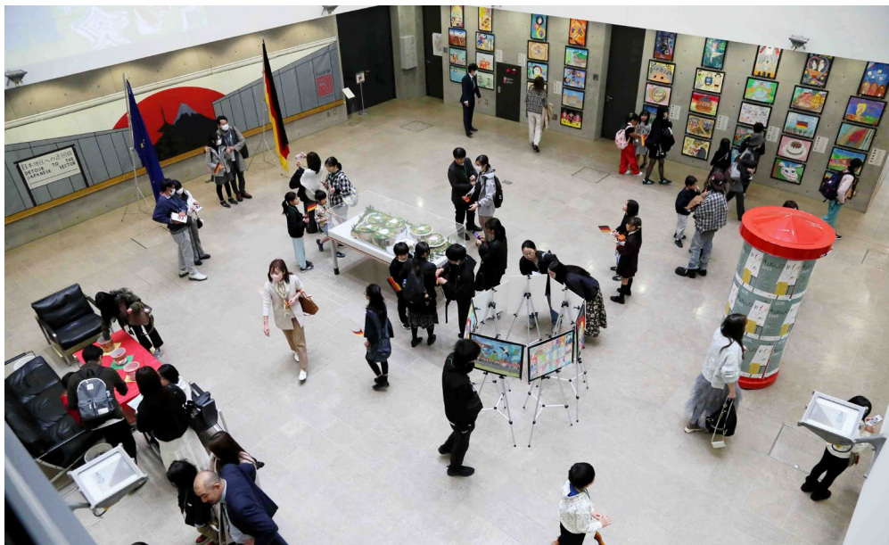
大使館アトリウムでの公開展覧会「オープン・デー」(2025年)